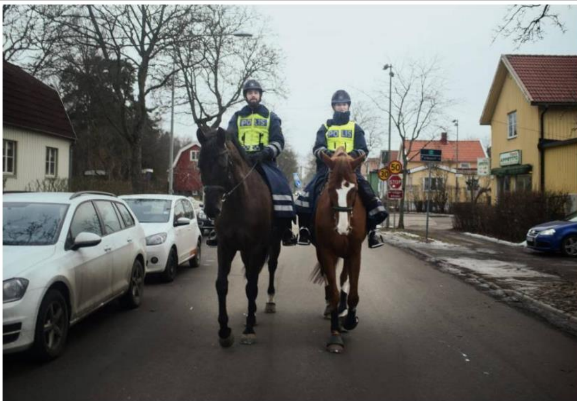
Polisen har plockat in polisryttare för att vakta Brommas gator.